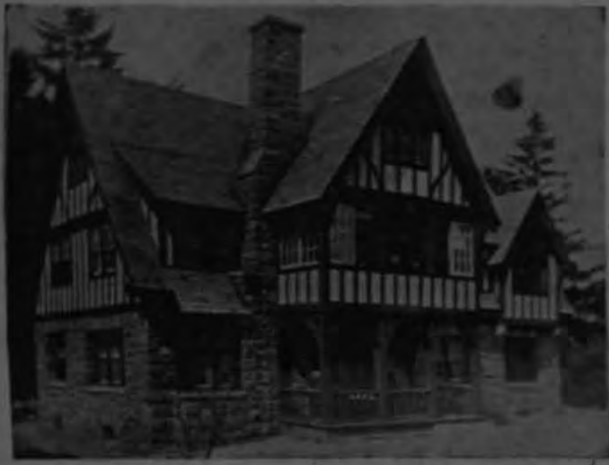
Estas dos fotografías dan idea de los distintos tipos de quintas usadas en el Sanatorio de Saranac Lake, para residencia de enfermos. Los enfermos duermen en los corredores, para recibir el beneficio del aire libre